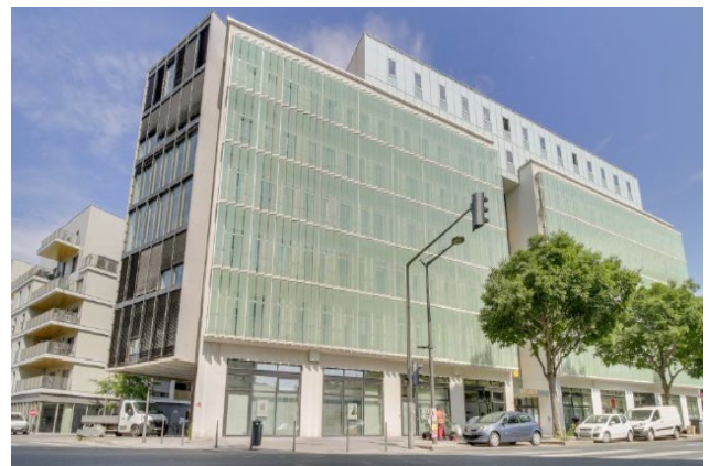
210 Avenue Jean Jaurès, Lyon

déjà d'un pipeline d'affaires attrayant en Allemagne, dont l'achèvement d'un projet de construction de logements à Oldenburg.